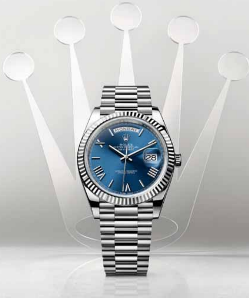
OYSTER PERPETUAL DAY-DATE 40 IN 18 CT WHITE GOLD

The international symbol of performance and success, reinterpreted with a modernised design and a new-generation mechanical movement. It doesn't just tell time. It tells history.